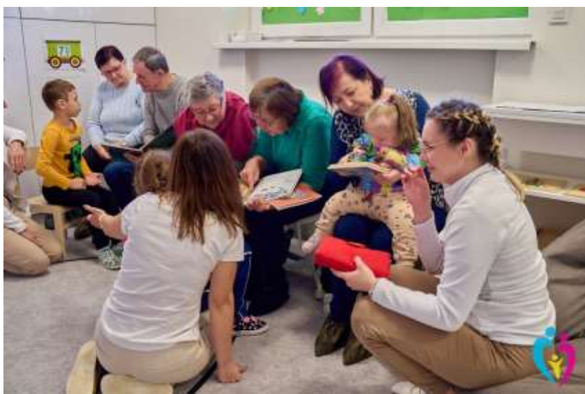
Foto 4: Akcia „Babka, dedko, Prečítaj mi rozprávku“ v spolupráci so Špeciálnou materskou školou pri SŠI Vo Vranove nad Topľou